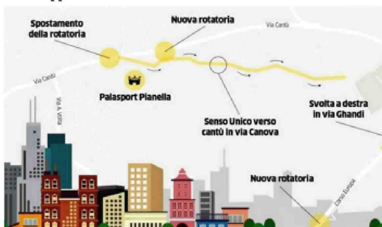
Le nuove rotonde vicino al palasport Pianella di Cucciago