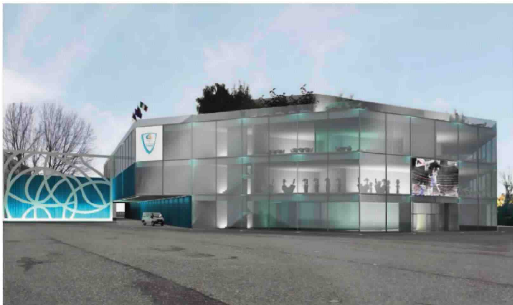
Sopra, il rendering del nuovo palazzetto di Cantù. Inizialmente è stato proposto per Cucciago, ora l'idea è di erigerlo nella città del mobile in corso Europa

La società ha come obiettivo la costruzione del nuovo palazzetto dello sport